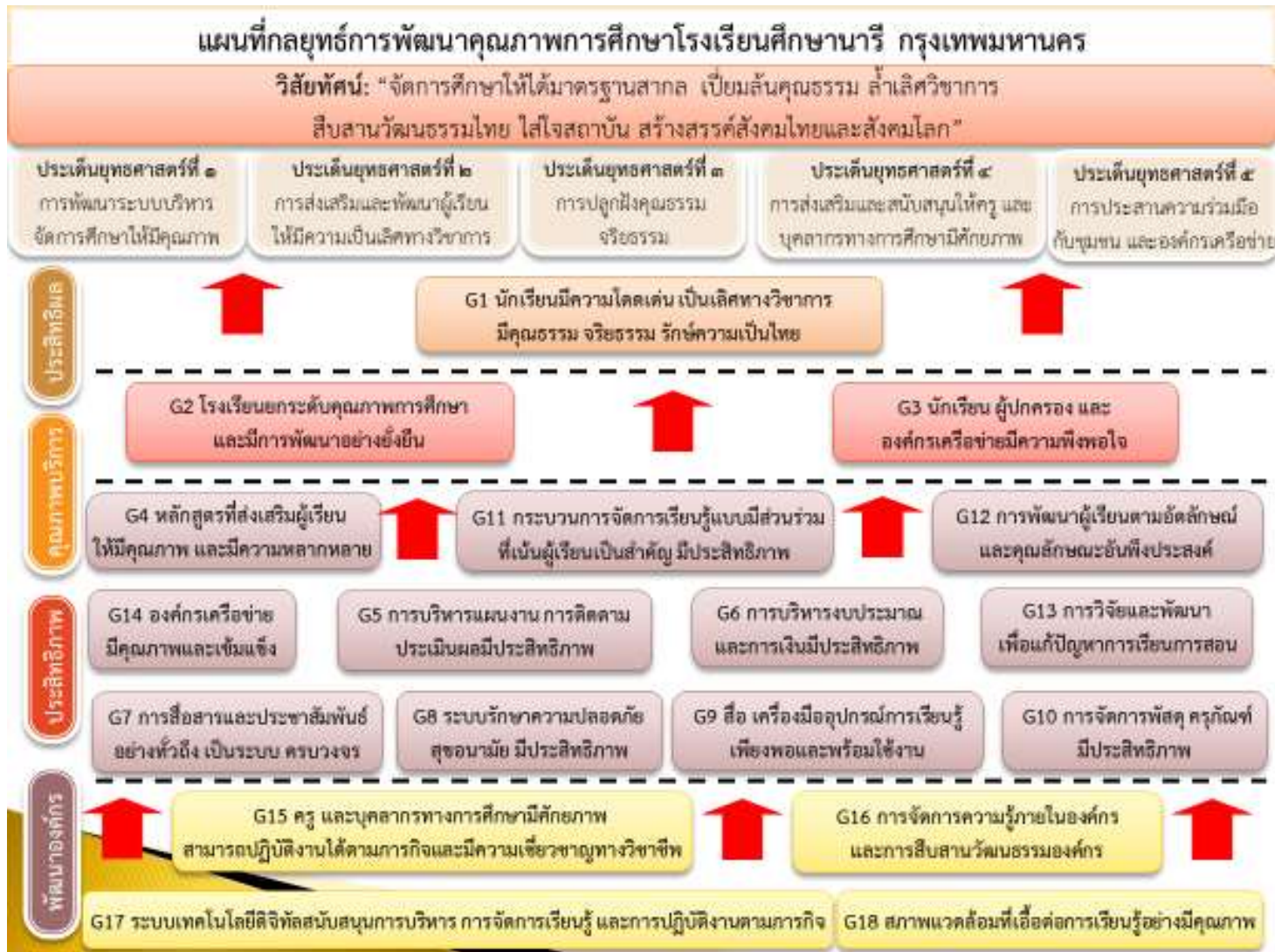
ภาพแสดงแผนที่กลยุทธ์โรงเรียนศึกษานารี